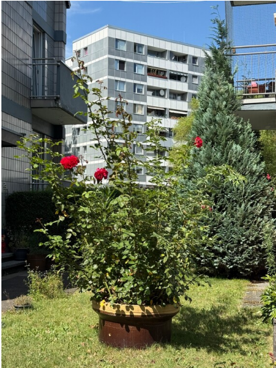
Wohnhaus der Steinzeugfabrik Cremer und Breuer (2025)