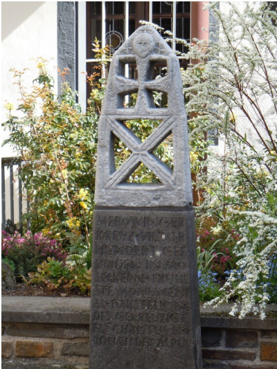
Replik der Stele von Moselkern auf dem Kirchhof der Pfarrkirche St. Valerius (2011)