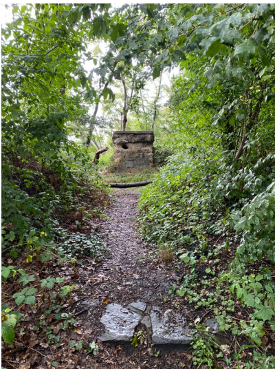
Blick auf die Reste des Ehrengrabes am Vorgebirge (2023)