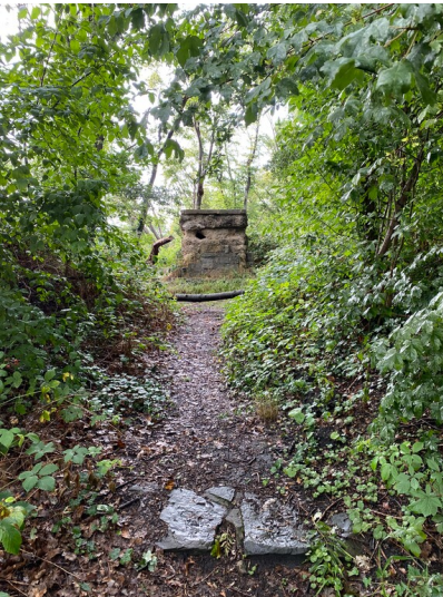
Blick auf die Reste des Ehrengrabes am Vorgebirge (2023)