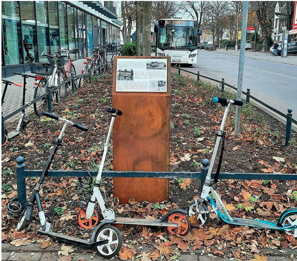
Die Gedenktafel an die Judendeportationen 1938 in Frechen-Königsdorf am 13. November 2020, dem Tag ihrer Enthüllung am neuen Standort.