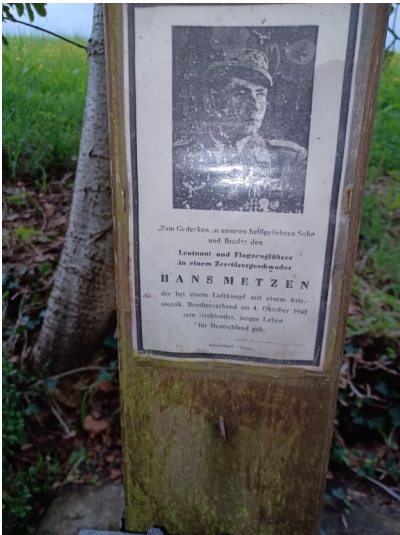
Bild und Gedenktafel Wegekreuz Steinsrott in Schmidt Fotograf/Urheber: Wolfgang Müller