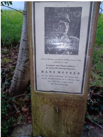
Bild und Gedenktafel Wegekreuz Steinsrott in Schmidt