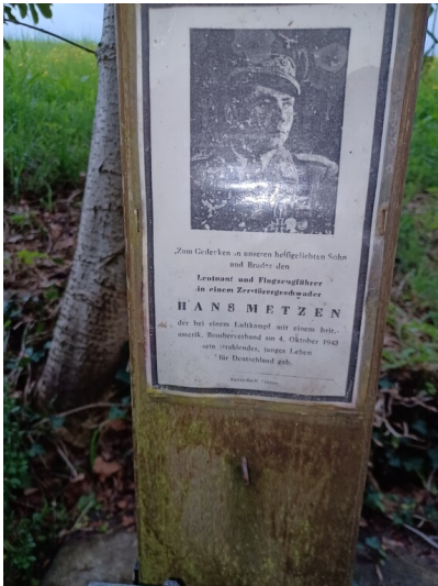
Bild und Gedenktafel Wegekreuz Steinsrott in Schmidt