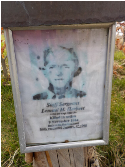
Bild von Herbert H. Lemuel auf dem Wegekreuz bei Feldpütz