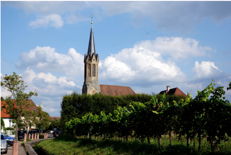
Katholische Kirche Sankt Gallus in Großfischlingen (2017)