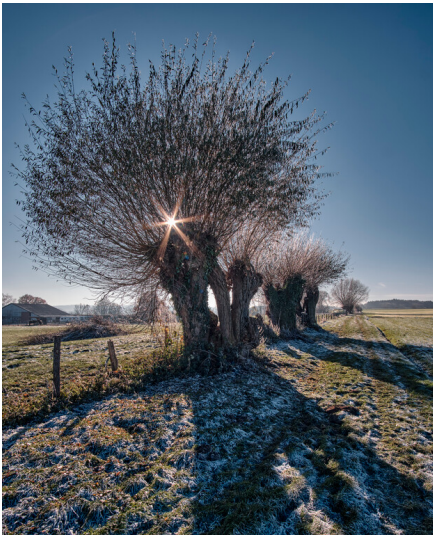
Kopfbäume entlang eines Zauns im Grünland in Aachen-Seffent (2022).