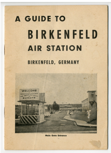
Ehemalige Birkenfeld Air Station