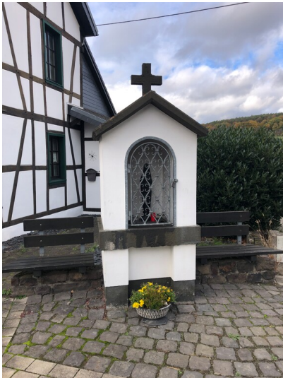
Bildstock an der Ecke Orsbeckstraße/Im Elsengarten in Löhndorf (2023)