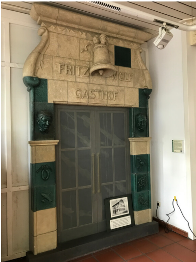
Keramikportal der Gaststätte "Zur Glocke" im Stadtarchiv Frechen (2022)