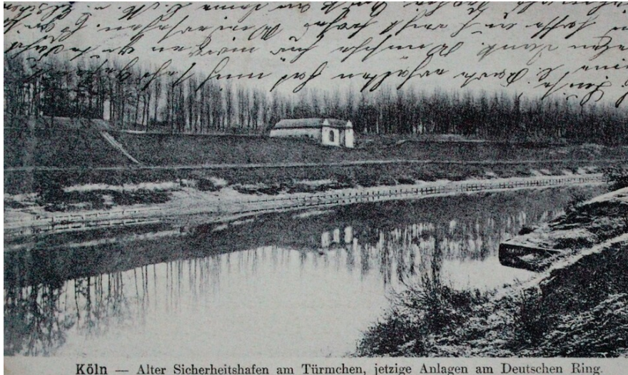
Köln — Alter Sicherheitshafen am Türmchen, jetzige Anlagen am Deutschen Ring