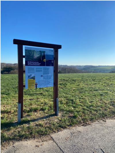
Die fünfte Station des Klosterlandschaftsweges beschäftigt sich mit den Zisterziensern als Landschaftsgestaltern (2024).