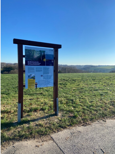
Die fünfte Station des Klosterlandschaftsweges beschäftigt sich mit den Zisterziensern als Landschaftsgestaltern (2024).