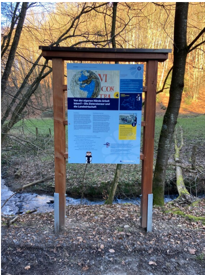
Die vierte Station des Klosterlandschaftsweges beschäftigt sich mit der Frage, wie die Zisterziensermonache die Landschaft bewirtschafteten (2024).