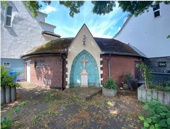
Verbindungstrakt mit Keramiknische und Bildstock in der Ulrichstraße (2024)