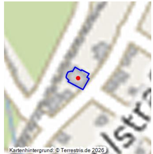
Die Kirche Sankt Valerius in Moselkern - ein virtueller 360-Grad-Rundgang (2023)

Die Pfarrkirche St. Valerius hebt sich in zwei Punkten aus der Masse der Dorfkirchen der Region heraus: Bei den Kirchenschiff handelt es sich um einen der wenigen frühklassizistischen Kirchenbauten des Trierer Kurfürstentums. Die Inneneinrichtung der 1930er bis 1960er Jahre stellt den Christkönig, den triumphierenden, in der Welt wirkenden Christus in den Mittelpunkt. Die Raumwirkung wird vor allem durch die Glasfenster bestimmt, die 1950-54 von dem namhaften Kunstprofessor und Glaskünstler Anton Wendling (1891-1965) gestaltet wurden.