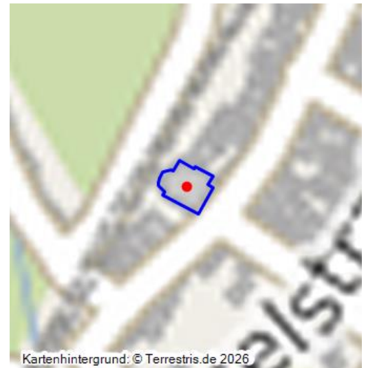
Die Kirche Sankt Valerius in Moselkern - ein virtueller 360-Grad-Rundgang (2023)

Die Pfarrkirche St. Valerius hebt sich in zwei Punkten aus der Masse der Dorfkirchen der Region heraus: Bei den Kirchenschiff handelt es sich um einen der wenigen frühklassizistischen Kirchenbauten des Trierer Kurfürstentums. Die Inneneinrichtung der 1930er bis 1960er Jahre stellt den Christkönig, den triumphierenden, in der Welt wirkenden Christus in den Mittelpunkt. Die Raumwirkung wird vor allem durch die Glasfenster bestimmt, die 1950-54 von dem namhaften Kunstprofessor und Glaskünstler Anton Wendling (1891-1965) gestaltet wurden.