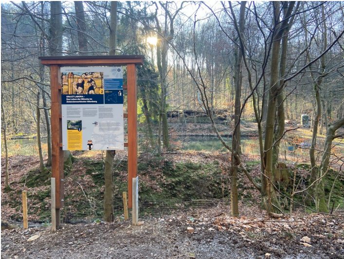
Die zweite Station des Klosterlandschaftswegs beschäftigt sich mit der Lebensweise der Zisterziensermönche (2024).