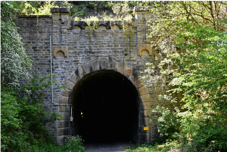
Südportal des Weidendell-Tunnel bei Zweifelscheid