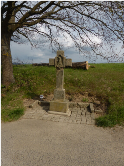
Wegkreuz südlich von Löhndorf (2021)