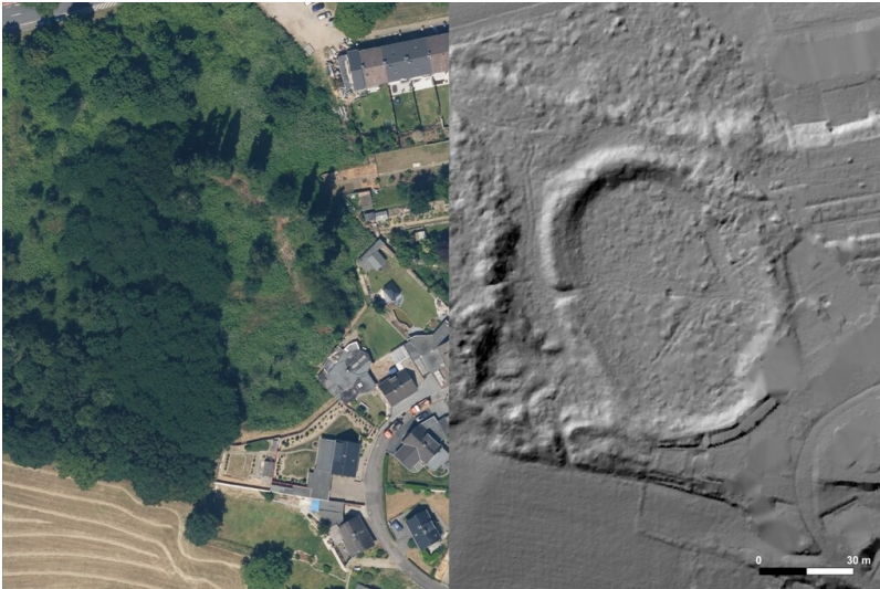
Luftbild und Laserscan des Areals der früheren Viersener Radrennbahn "am Baggerfeld" (2023).