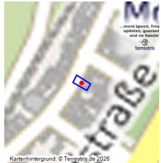
Das Alte Rathaus in Moselkern - ein virtueller 360-Grad-Rundgang (2023)

Dieses repräsentative Haus in der Oberstraße zeigt den Bürgerstolz der Gemeinde Moselkern. Es wurde im 16. Jahrhundert als Rathaus erbaut. Nach einer umfassenden Renovierung wurde es 1907 zur Niederlassung einer Schwesternkongregation, genannt „Haus Nazareth“. Diese bestand bis 1969.