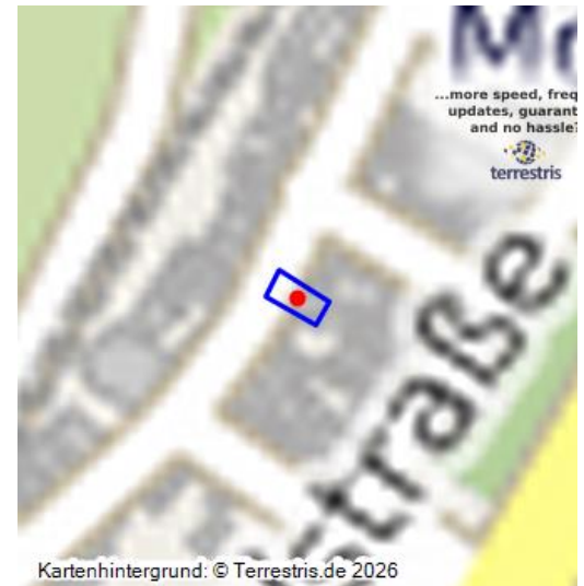
Das Alte Rathaus in Moselkern - ein virtueller 360-Grad-Rundgang (2023)