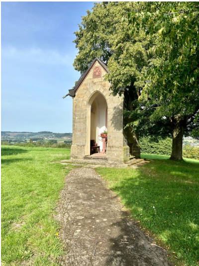
Stedemer Kapellchen in Niederstedem