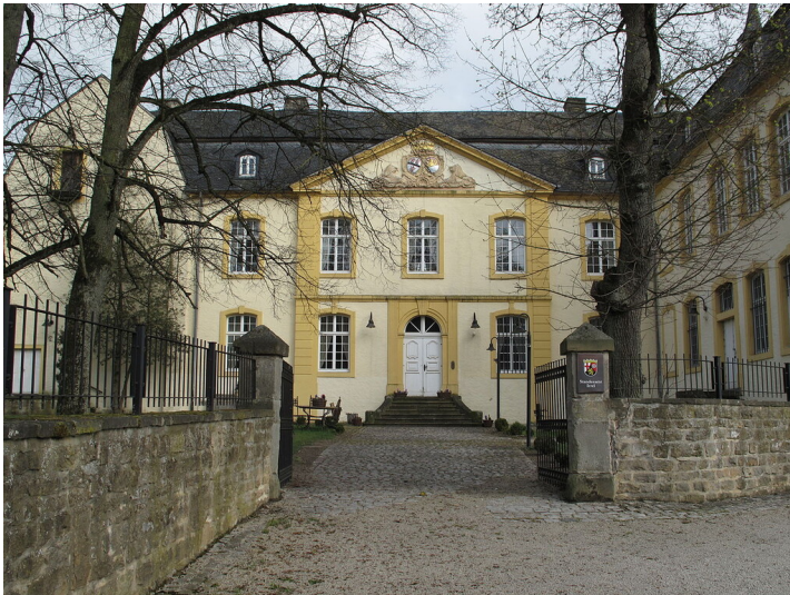
Schloss Niederweis