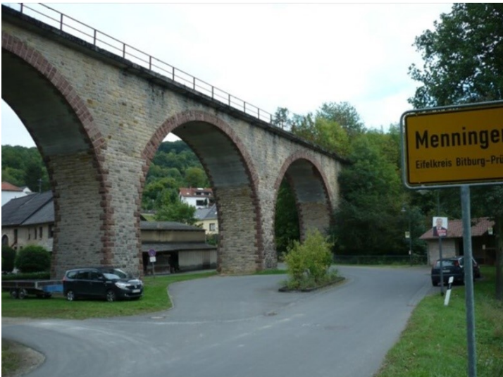
Eisenbahnviadukt in Menningen