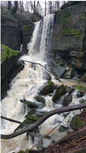
Tanzlay zwischen Bitburg Mötsch und Hüttingen an der Kyll