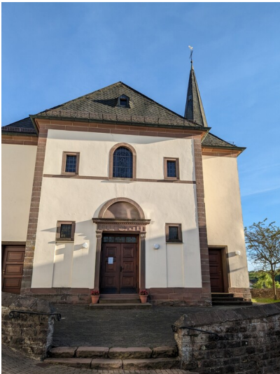
Pfarrkirche St. Peter in Neidenbach