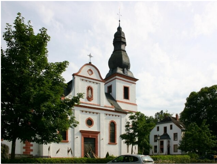
Katholische Pfarrkirche St. Hubertus in Körperich Fotograf/Urheber: Kreisverwaltung Eifelkreis Bitburg-Prüm, erstellt im Rahmen des Zukunfts-Check Dorf