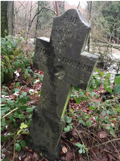
Bohler-Kreuz in Nasingen