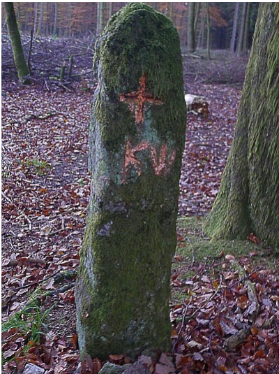
Langer Stein bei Kleinlangenfeld