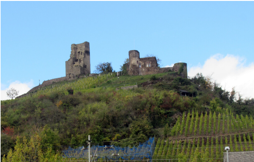
Burg Coraidelstein bei Klotten