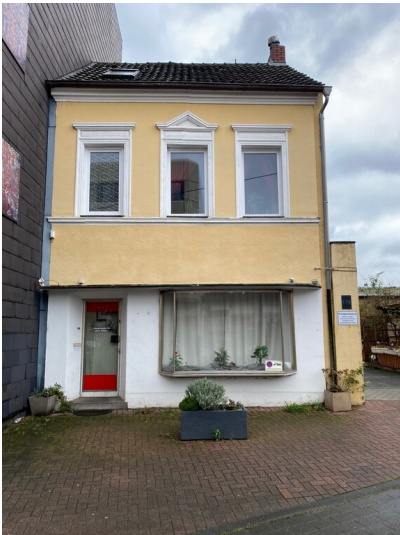
Wohn- und Geschäftshaus der Töpferei Frentz (2023)