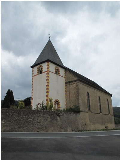
Filialkirche St. Johannes in Niederweis

Schlagwörter: Pfarrkirche , Kirchengebäude Fachsicht(en): Denkmalpflege , Landeskunde Gemeinde(n): Niederweis Kreis(e): Eifelkreis Bitburg-Prüm Bundesland: Rheinland-Pfalz