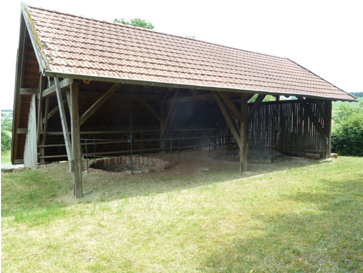
Kalköfen bei Gransdorf Fotograf/Urheber: Kreisverwaltung Bitburg-Prüm, erstellt im Rahmen des Zukunfts-Check Dorf, 2023