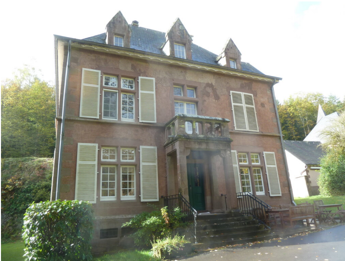
Jagdschloss Merkeshausen