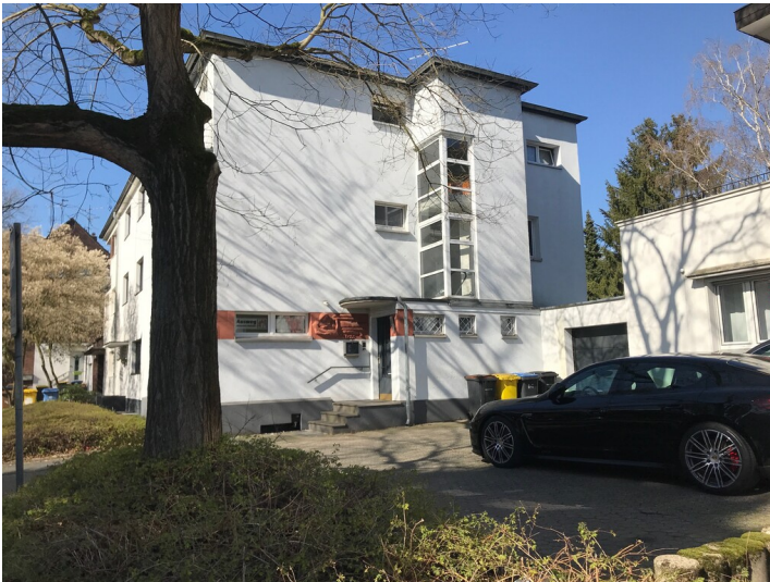
Wohnhauszeile an der Franz-Hennes-Straße (2020)