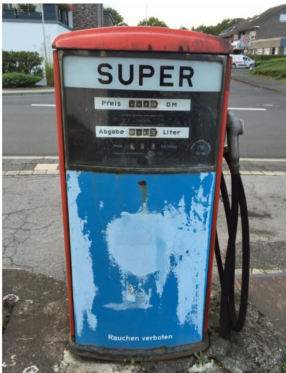
Das Relikt einer zeitgenössisch-original erhaltenen Super-Zapfsäule am früheren Standort einer FINA-Tankstelle an der Norbertstraße in Dormagen-Straberg (2023).