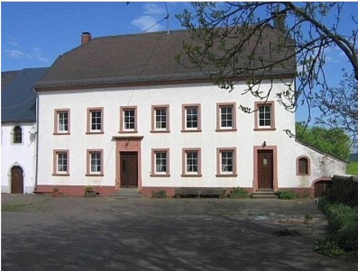
Dreiseitenhof in Sevenig bei Neuerburg Fotograf/Urheber: Kreisverwaltung Eifelkreis Bitburg-Prüm, erstellt im Rahmen des Zukunfts-Check Dorf