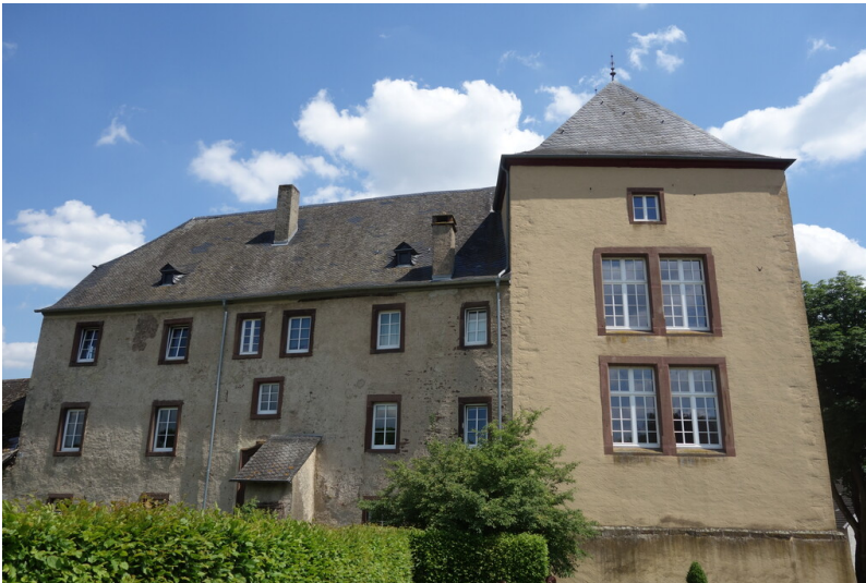
Burg Dudeldorf