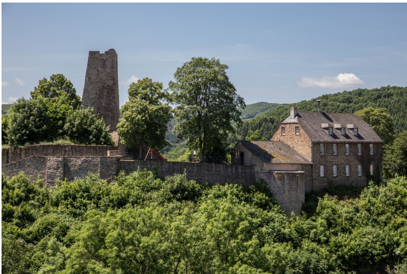
Burgruine Dasburg