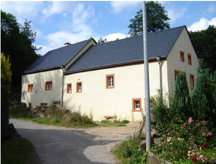
Biermühle bei Gransdorf