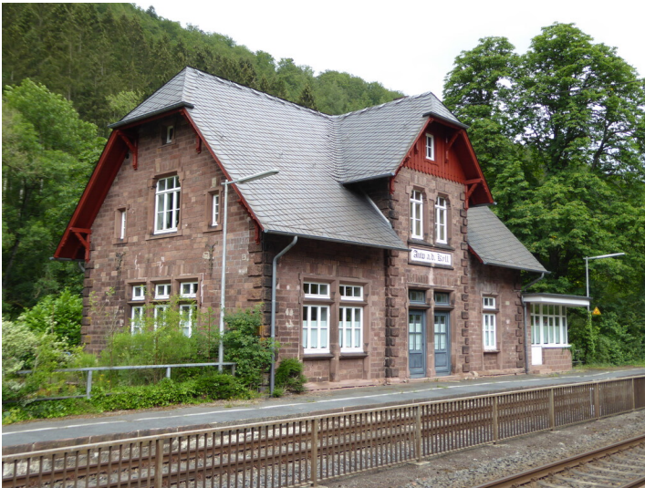
Bahnhof Auw an der Kyll