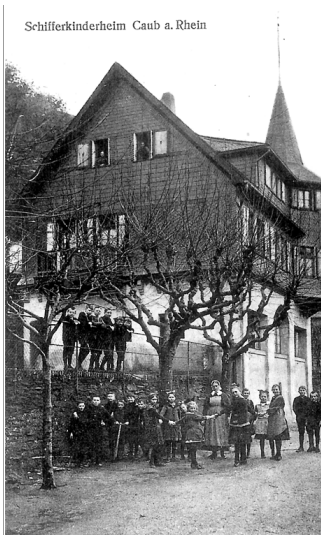
Das Schifferkinderheim in Kaub, damals noch Caub, am Rhein (um 1920)