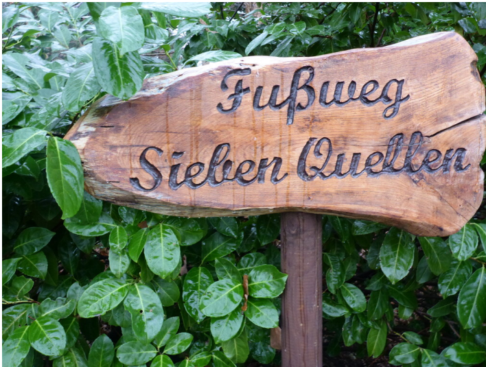
Hinweisschild zum Fußweg Sieben Quellen (2022)