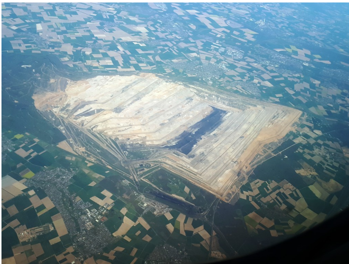
Blick aus dem Flugzeug auf den Tagebau Hambach zwischen Jülich, Bergheim, Kerpen und Düren im Rheinischen Braunkohlerevier (2019). Links im Bild die Abraumhalde Sophienhöhe und rechts der Bereich des Bürgewaldes bei Morschenich / Mannheim.