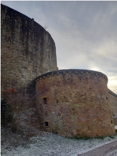
Der erste nördliche Zwingerturm der Burg Lichtenberg bei Thallichtenberg (2023)