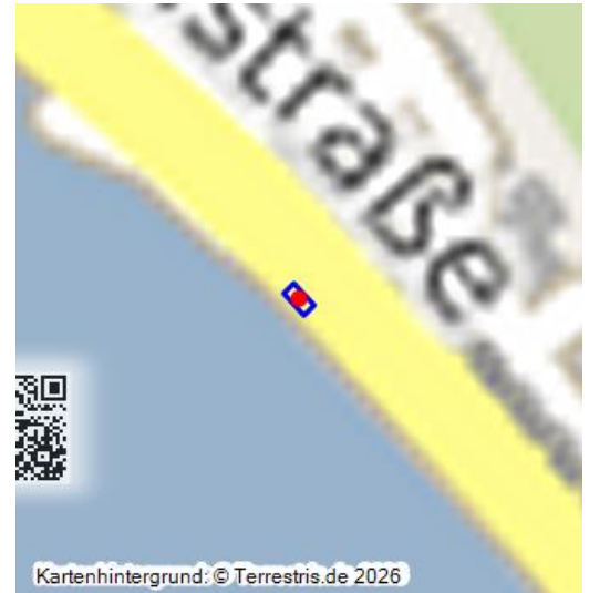
Das Lotse nmuseum im alten Lotse nhaus in Kaub - eine virtuelle 360-Grad-Ansicht (2022)

Am Kauber Rheinufer, nahe dem Fähranleger, befindet sich das Lotse nmuseum Kaub. Dieses war als Aufenthaltsraum für die Kauber Lotse n erbaut worden. Heute wird es als kleines Museum genutzt und vermittelt Wissen zur Arbeit der Kauber Rheinlotse n. Ein Lotse ist ein nautischer Berater der dem Schiffsführer hilft gefährliche Streckenabschnitte zu befahren. Früher wurde dieser Beruf öfter ausgeübt als heute in Zeiten der Radar unterstützten Fluss- und Seeschiffahrt.