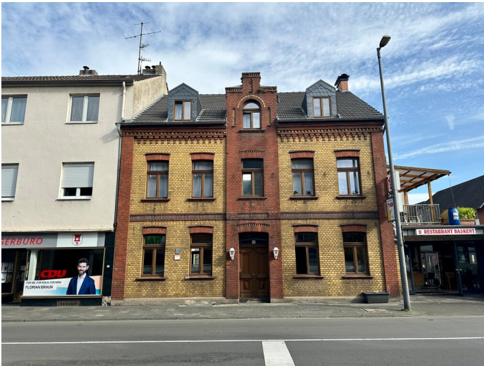
Das Haus Hauptstraße Nr. 388 entstand um 1900. Die zweifarbige Backsteinfassade nimmt mit ihren fünf Achsen viel Raum ein (2023).